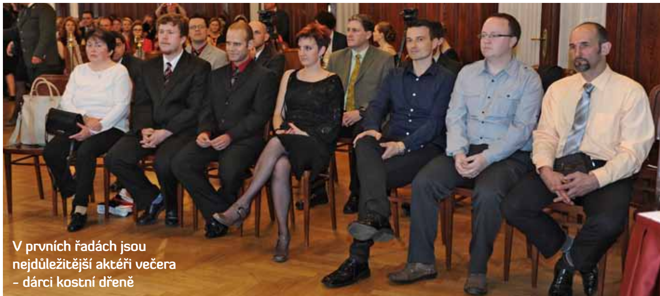
V prvních řadách jsou nejdůležitější aktéři večera – dárci kostní dřeně