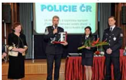
▲ Za nejvýznamnější nemateriální pomoc byla oceněna Policie ČR.