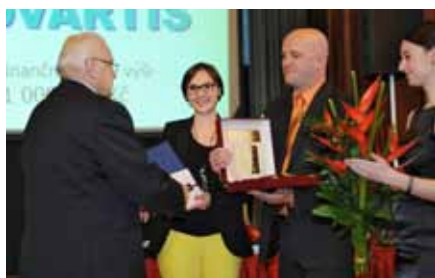
▲ Za nejvýznamnější finanční pomoc byla oceněna firma Novartis Česká republika.