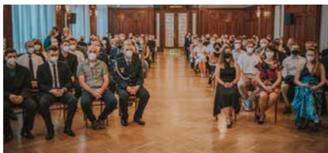
Jen díky těmto dobrodincům mohla být pacientům bez dárce v rodině transplantována kostní dřeň.

V pořadí již dvacátý třetí ročník akce Poděkování dárcům, kterým Český národní registr dárců dřeně a Nadace pro transplantace kostní dřeně oceňují ty, kteří neváhali někomu zcela neznámému svými krvetvornými buňkami dát šanci na další život, se konal v pražském Obecním domě 18. 6. 2021. Cenu za svůj mimořádný čin v předchozím roce tu převzalo osobně celkem 33 dárců z celé republiky, dalších 29 dárců ocenily obě organizace alespoň distančně.