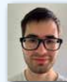
Milan Ročeň Šestajovice, o. Praha - východ