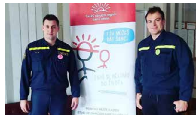
Rovná třicítka nových hrdinů z Českého Krumlova je mezi námi!

Rok 2023 je ve znamení mnoha náborů dobrovolných dárců kostní dřeně. Přibýly stovky nových hrdinů