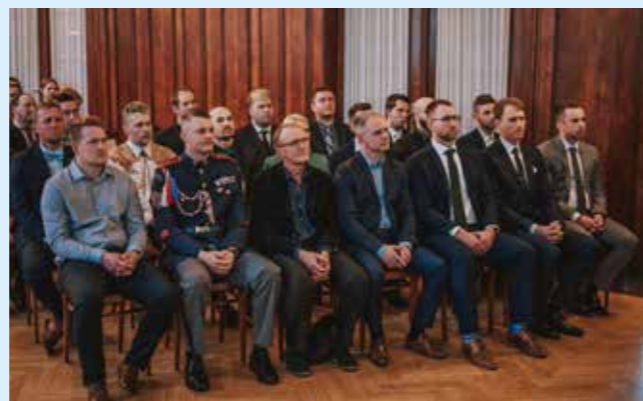
Velké poděkování partnerům akce, kterými byly: společnost Obecní dům, společnost Moser, cateringová společnost Vyšehrad a Mažoretky Sokol Blatná.

DMS KOSTNIDREN 30 DMS KOSTNIDREN 60 DMS KOSTNIDREN 90