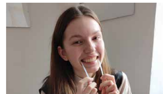
98 dobrovolníků – tolik nových studentů se k nám zaregistrovalo na Klvaňově gymnáziu a Střední zdravotnické škole Kyjov.