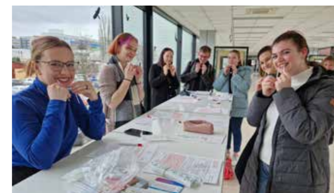
Hlásíme necelou padesátku nových nadějí na život z Lékařské a farmaceutické fakulty v Hradci Králové.