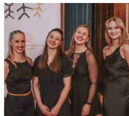
Ozdobou večera byly jako pokaždé mažoretky PREZIOSO Sokol Blatná, které pomáhaly s organizací.