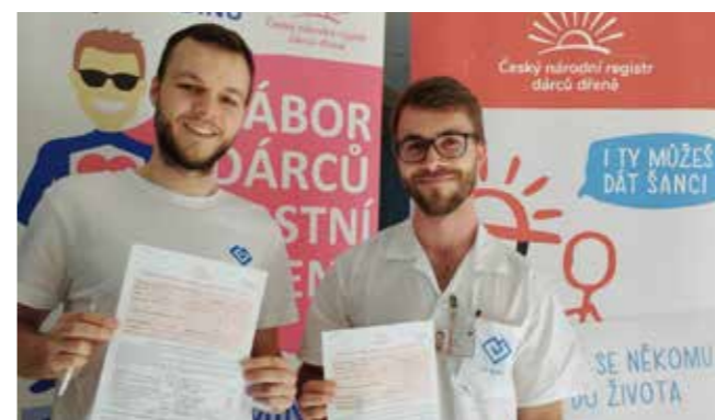
V pražském Motole se mezi nás přidalo rovných 101 odvážných z řad studentů a zaměstnanců.