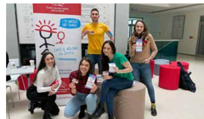
Děkujeme medikům i zaměstnancům fakulty do Plzně, téměř šedesátka nových hrdinů je mezi námi!