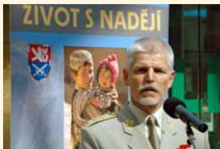
Náčelník Generálního štábu Armády České republiky generálporučík Petr Pavel

Náčelník Generálního štábu AČR generálporučík Petr Pavel považuje myšlenku zapojení vojáků do projektu za věc užitečnou a chvályhodnou. „Je to zároveň i naplnění toho, co by armáda měla dělat - pomáhat a přispívat - a to i v této oblasti,“ uvedl při slavnostním zahájení projektu v pražské Ústřední vojenské nemocnici s tím, že v tuto chvíli dvojnásob lituje, že mu není pod pětatřicet. „Zaprvé proto, že by to bylo fajn, a zadruhé proto, že bych ještě pořád spadal do limitu dárců a určitě bych rád šel příkladem.“ Projekt Armáda dává naději podpořila také olympijská vítězka v hodů oštěpem a členka ASC Dukla Bára Špotáková. „Velice dobře si uvědomuji, že hranice mezi tím, kdy je člověk naprosto zdravý a kdy se dny přelomí a může to být úplně naopak, je velice úzká,“ sdělila a dodala: „Jsem ráda, že armáda jde takto příkladem.“ První dárci z řad armády se do Českého národního registru přihlásili ve středočeské vojenské nemocnici vzápětí.