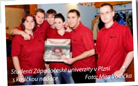
Studenti Západočeské univerzity v Plzni s kasičkou nadace