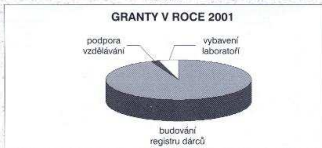
Graf č. 4

Poznámka: v roce 2001 bude vypsáno grantové řízení na finanční prostředky získané z výnosů nadačního jmění, které bylo pořízeno z prostředků I. kola výběrového řízení NIF.