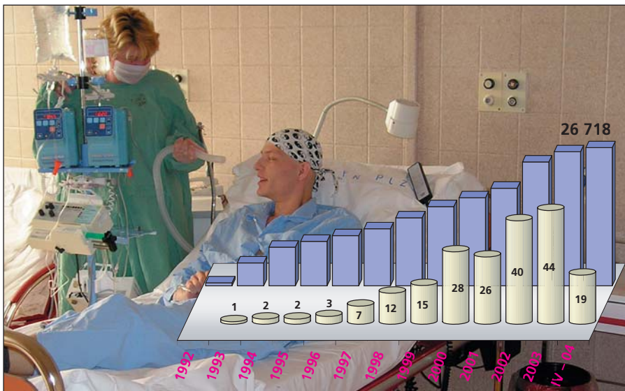
■ roční počty transplantací ■ růst databáze dárců