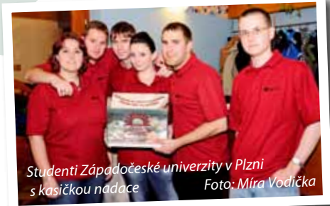
Studenti Západočeské univerzity v Plzni s kasičkou nadace