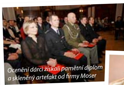
Ocenění dárci získali pamětní diplom a skleněný artefakt od firmy Moser

„V roce 1992 jsme provedli jednu transplantaci kostní dřeně od nepříbuzenského dárce z našeho registru. Vloni jich bylo celkem 110, což je neuvěřitelné. Jsme jednou z největších českých nadací. Český národní registr dárců je jediným registrem v ČR i ve východní Evropě akreditovaným Světovou asociací dárců dřeně WMDA. Hematologicko-onkologické oddělení Fakultní nemocnice Plzeň navíc získalo na celý program trans-