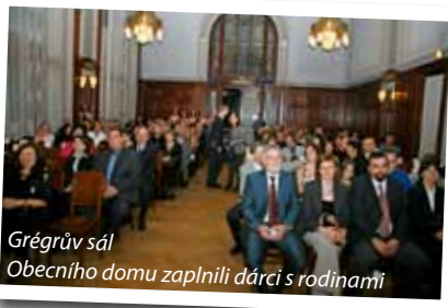
Grégrův sál Obecního domu zaplnili dárci s rodinami

společnost Barum Otrokovice, z níž vzešlo již šest dárců kostní dřeně. Tato společnost navíc pravidelně každý měsíc přispívá Nadaci pro transplantace kostní dřeně, neboť mnozí její zaměstnanci, včetně managementu, darují každý měsíc zlomek ze svého platu právě ve prospěch nadace.